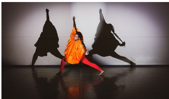
Notre trinité intérieure

(mens), et ce même en étant pleinement motivé par le saint amour de soi (amor).