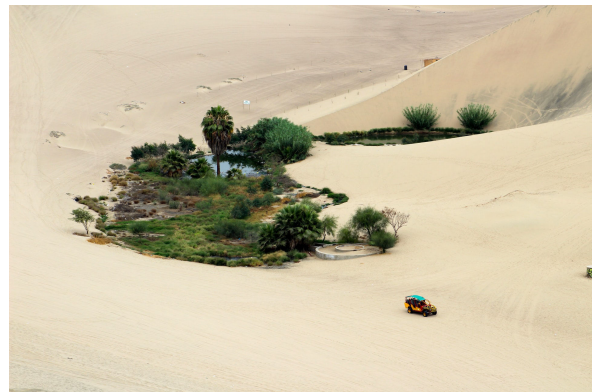
Oasis comme ressourcement pour traverser les déserts de la vie

Cependant, force est de constater que cette connaissance de soi reste partielle bien que certaine et qu'elle grandit dans la traversée de notre vie. Elle grandit tout aussi bien dans la traversée de nos déserts existentiels que dans la traversée des oasis, même si évidemment pour pouvoir tenir dans la durée de cette longue traversée trop souvent désertique, il est bon de savoir se ressourcer dans les oasis que la vie parfois de manière fort surprenante et inattendue nous offre au travers des amitiés, de l'amour partagé et des beautés de la création.