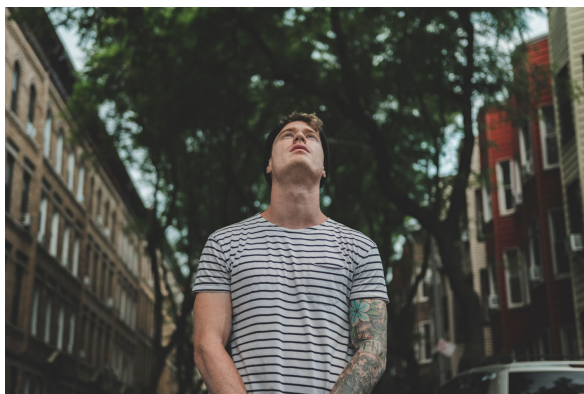
S'interroger en sachant écouter

pour apprendre à se découvrir, c'est finalement se mettre à écouter cette brise légère qui vivifie notre cœur, brise légère qui vient d'ailleurs, du Tout Autre. Il y a donc de l'altérité au fond même de notre être, et cette altérité loin de nous aliéner est justement celle qui nous permet de mieux découvrir notre identité personnelle.