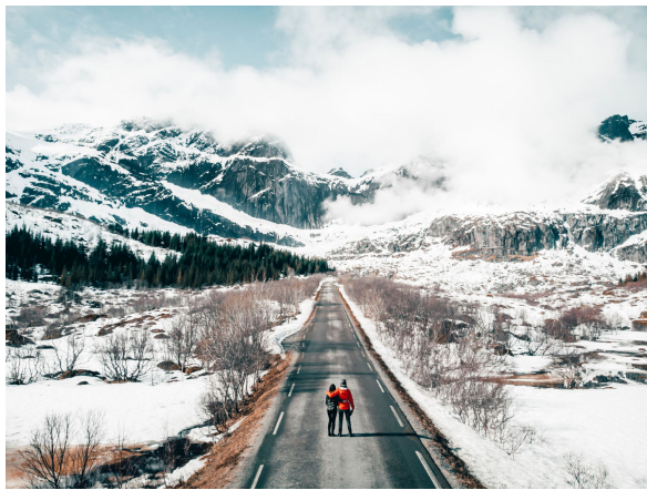
L'identité d'exode fortifiée par l'amitié

pour nous de toute éternité, soit au contraire forger un moi superficiel nouveau ou accentuer un moi superficiel ancien qui nous éloignent un peu plus encore de ce que nous sommes réellement. Prendre conscience qu'à chaque petite épreuve de notre vie nous pouvons répondre par notre manière propre d'agir soit en devenant un peu plus un habitant de la cité de Dieu, soit en devenant un peu plus un habitant de la cité du diable, semble être crucial pour fortifier une réelle liberté de choix. Bien sûr, nous n'avons pas toujours l'énergie suffisante pour réussir à faire le bon choix, c'est là que notre cri de détresse vers Dieu est si important. Le psaume 76 nous le rappelle.